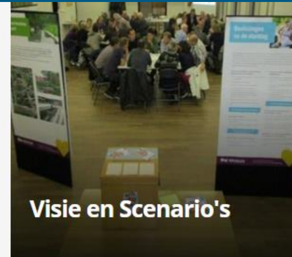
Visie en Scenario's